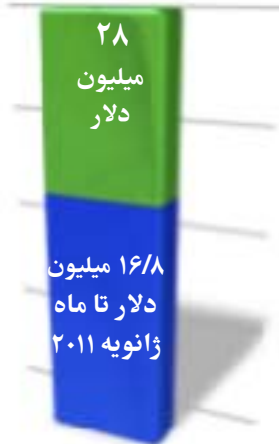
تبرّعات ارسال شده به صندوق ملی

توجه: در کافه امنای صندوق بهائی (Treasurers' café) می توانید لینک پرسش و پاسخ شماره های قبلی "مردم چه فکر می کنند" که در بولتن امنای صندوق بهائی درج می شود را بیابید.