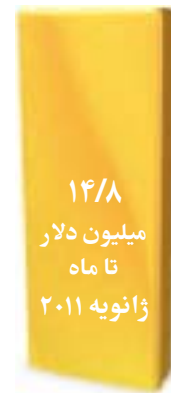
تبرّعات رسیده برای ساختمان مشرق الاذکار شیلی

جامعه بهائی امریکا می کوشد تا سهم بزرگ خود در تأمین هزینه تخمین شده ۳۸ میلیون دلار برای ساخت مشرق الاذکار شیلی را تأمین کند.