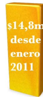
Iniciativa Templo de Chile

La comunidad de los Estados Unidos esta empeñada en aumentar la parte del estimado de $38 millones que se necesitan para el Templo de Chile.